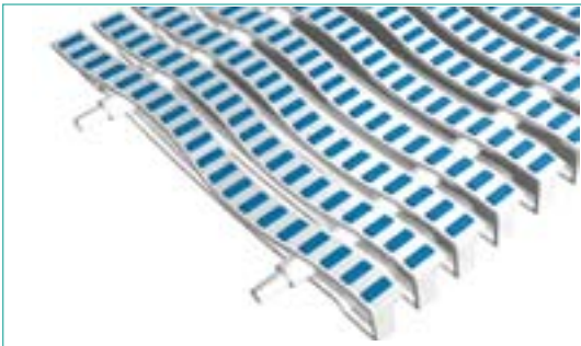
TWIN ONDA B/B (BIANCO/BIANCO)